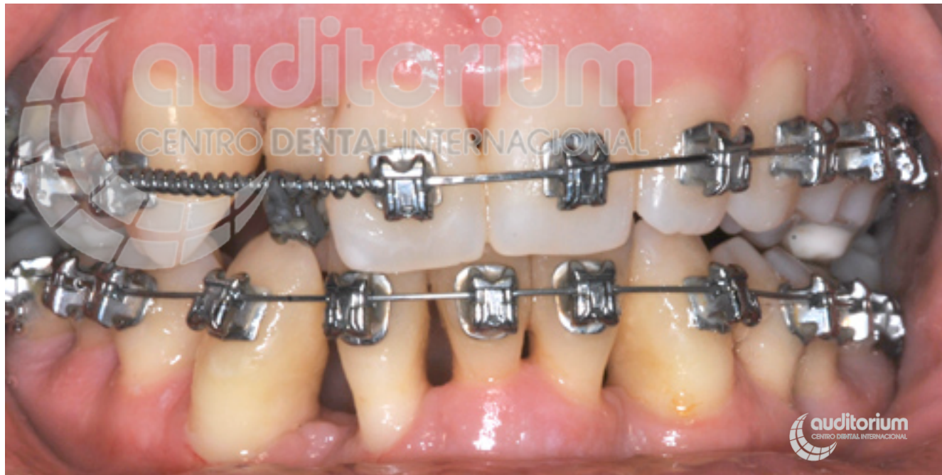
Primera parte del tratamiento de ortodoncia.