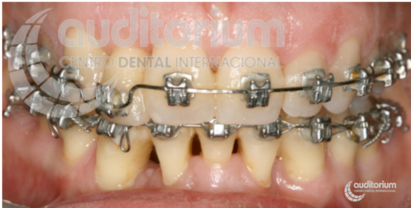
Final de la ortodoncia.