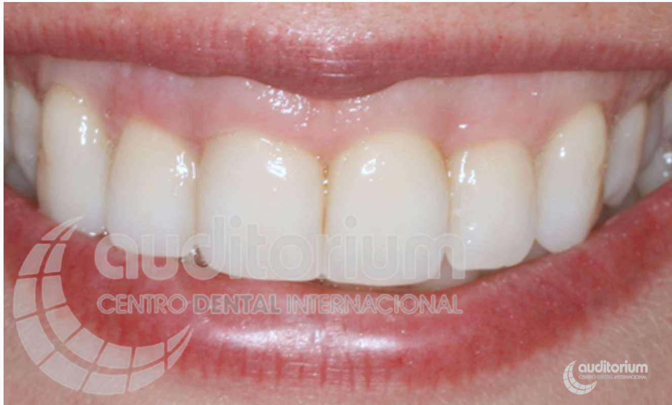
Foto del tratamiento de periodoncia, ortodoncia, blanqueamiento y cierre de troneras finalizado.