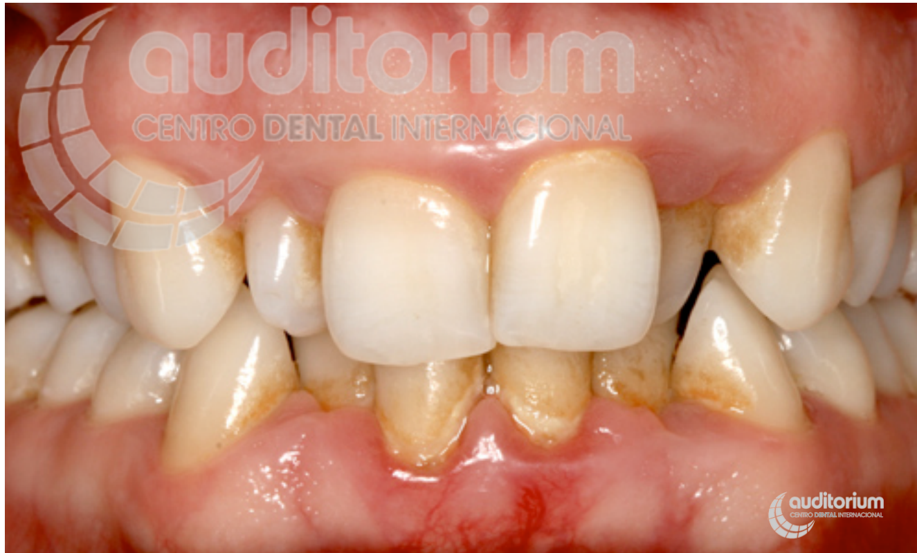
Paciente con periodontitis.