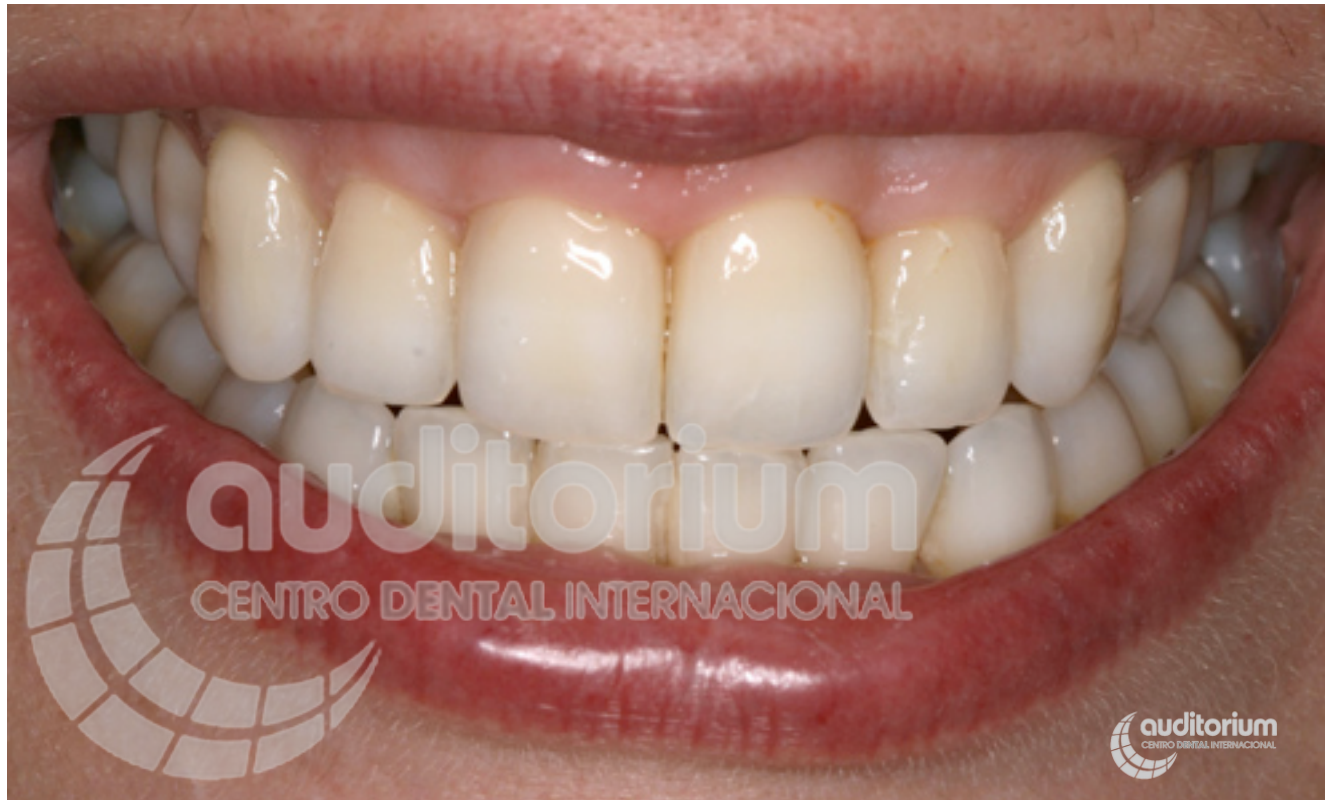
Cierre de triángulos negros (troneras).